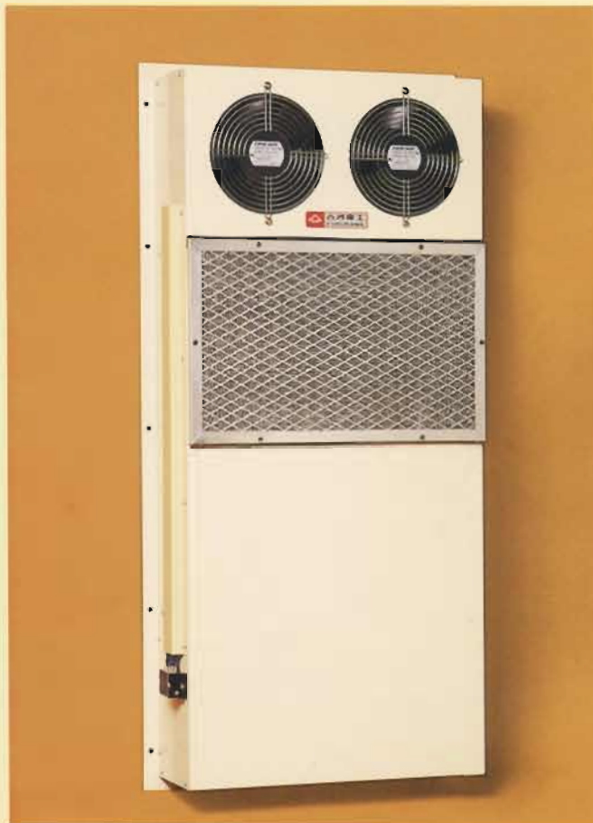
扉(側面)設置型 10Z-2R-440L (写真は外付タイプ)

近年、制御盤、操作盤、配電盤、計測盤などには、コンピュータ、NC装置、精密機器、電子機器などが内蔵されることが多くなっています。これらの盤は塵埃、オイルミスト、湿気、有毒ガスなど環境の悪い場所で使用しますと機能劣化、誤作動など不具合が発生するため筐体の密閉化と、それにともなって内部にたまる熱の放出が必要になります。